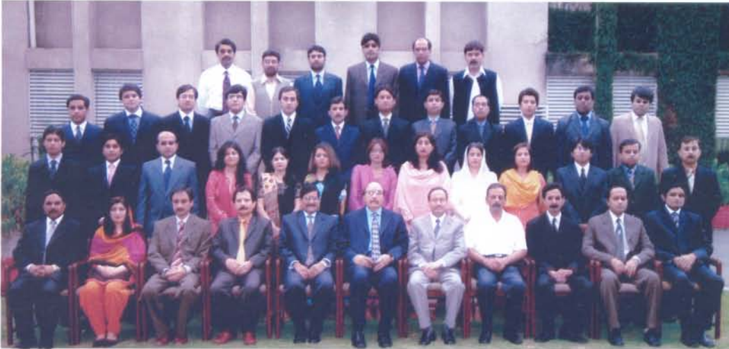
۳۱ ویں خصوصی تربیتی پروگرام کے افسران کی پاسنگ آؤٹ کے موقع پر ڈائریکٹر جنرل اور دیگر افسران کے ساتھ ایک یادگار تصویر

ڈائریکٹریٹ جنرل آف انکم ٹیکس ٹریڈنگ اینڈ ریسرچ، سٹیج بلاک، علامہ اقبال ٹاؤن، لاہور